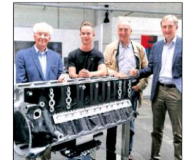
Junkers-Motor für Technikmuseum Das Technikmuseum Kassel hat einen atemberaubenden Blick in die Vergangenheit der Luftfahrt. In der Ausstellung sind die Motoren der Junkers-Flugzeuge zu sehen. Ein dieser Motoren ist ein 650 Kilogramm schwerer Motor der Marke Junkers, der in den 1940er Jahren in Kassel gefertigt wurde. Die POLYMA hat diesen Motor restauriert und stellt ihn nun im Technikmuseum Kassel aus. Der Motor ist ein 650 Kilogramm schwerer Motor der Marke Junkers, der in den 1940er Jahren in Kassel gefertigt wurde. Die POLYMA hat diesen Motor restauriert und stellt ihn nun im Technikmuseum Kassel aus.

Die POLYMA unterstützte das Kasseler Technikmuseum bei der Restaurierung eines Flugzeugmotors der Marke „Junkers“. Diese Motoren wurden in den 1940er Jahren mit einer Vielzahl von Komponenten aus dem Kasseler Werk an der Lilienthalstraße produziert. Den rollbaren Halter für das 650 Kilogramm schwere Exponat spendierte POLYMA. Er wurde von uns gezeichnet, ausgelegt, zugeschnitten und geschweißt. Das Material dafür hat POLYMA gestellt. Der Halter wurde mit einem Spiegel ausgestattet, damit die Einspritzpumpe des Motors auch von innen betrachtet werden kann. (K. Saß)